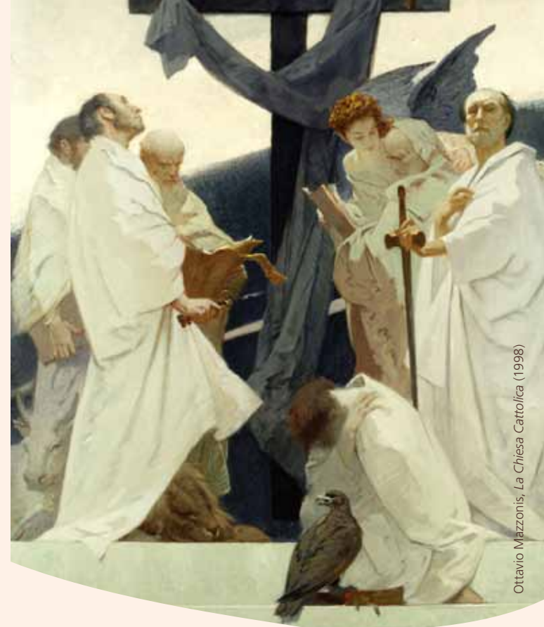
Ottavio Mazzonis, La Chiesa Cattolica (1998)