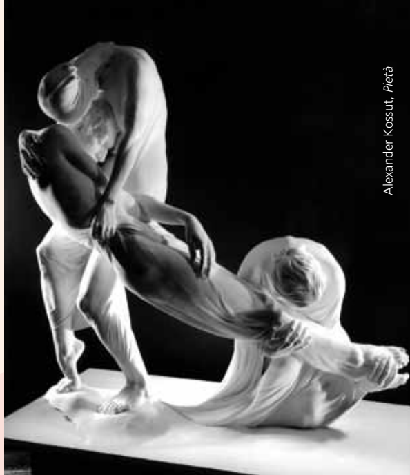
Alexander Kossuth, Pietà

La suggestione dell'arte che ha meditato sulla nascita, sulla sofferenza, sulla morte, sulla risurrezione di Cristo e sulla salvezza che ci ha voluto donare, induce il visitatore a ripensare i propri valori, ad analizzare la propria vita alla luce della vera Vita, ad approfondire la riflessione sulle domande sollevate dai risultati della ricerca nel campo delle scienze della vita. Anche gli artisti con le loro opere sono chiamati a partecipare alla impresa di dare senso all'avventura umana.