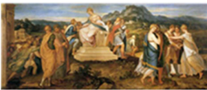
02 Lambert Sustris Cerchio della frode 1540-1545 circa Olio su tela Fondazione di Studi di Storia dell'Arte Roberto Longhi, Firenze