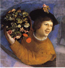
01 Dosso Dossi Giovane con canestro di fiori 1524 – 1526 Olio su tela Fondazione di Studi di Storia dell'Arte Roberto Longhi, Firenze