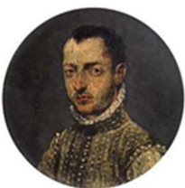
03 El Greco, attr. a Ritratto di gentiluomo 1570 circa Olio su lavagna Fondazione di Studi di Storia dell'Arte Roberto Longhi, Firenze